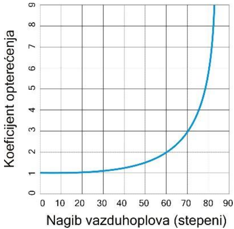
Slika PPL PoF-1.